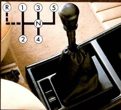
Boîte 5 vitesses

*Consommation normes UTAC : 5,4 l à 90 km/h, 7,2 l à 120 km/h, 7,3 l en parcours urbain. Garantie 6 ans anticorrosion Talbot.