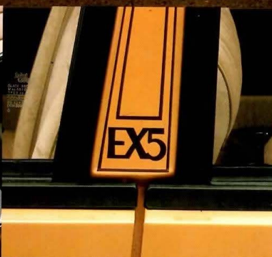
Monogramme E-X 5